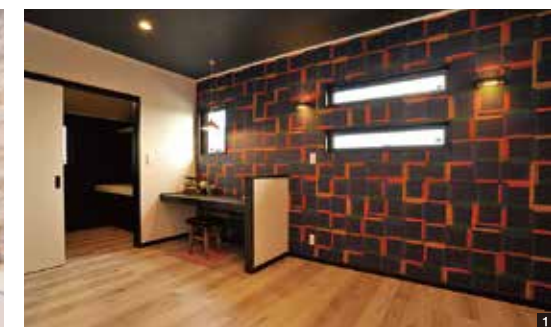
1 書斎を備えた寝室。クロスもスタイリッシュにニューヨークスタイル 2 玄関ホールには、リビングの床下を利用したディスプレイスペースを造作 3 家族を近くに感じながらお勉強。スキップフロアのスタディーコーナー