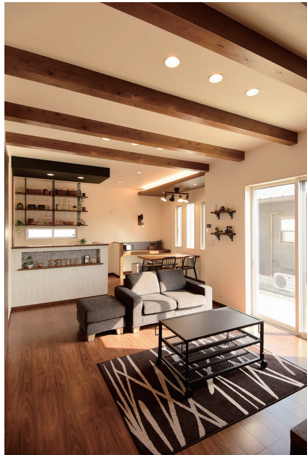
「耐震住宅の北川副モデルハウス」リビング。広さ19.7畳、天井高2.8mと広々

耐火仕様も取り入れています。また、「北川副モデルハウス」は、高い断熱性能、省エネルギー設備に加え太陽光発電も搭載しています。家庭で使うエネルギー量は「HEMS（ハムス）」システムによってモニター画面でリアルタイムで把握することが可能。どの電気機器が今どのくらいの電力を消費しているのかが一目で分かり、節電につながります。ZEHビルダーとして実績のあるエススタイルだから出来る提案や、細部にまで気配りのある設備を見学しながら、我が家にはどんな設備を取り入れるか、ご家族で話し合うのも楽しい時間。家づくりへの夢とイメージがどんどん膨らむ、素敵なモデルハウスです。